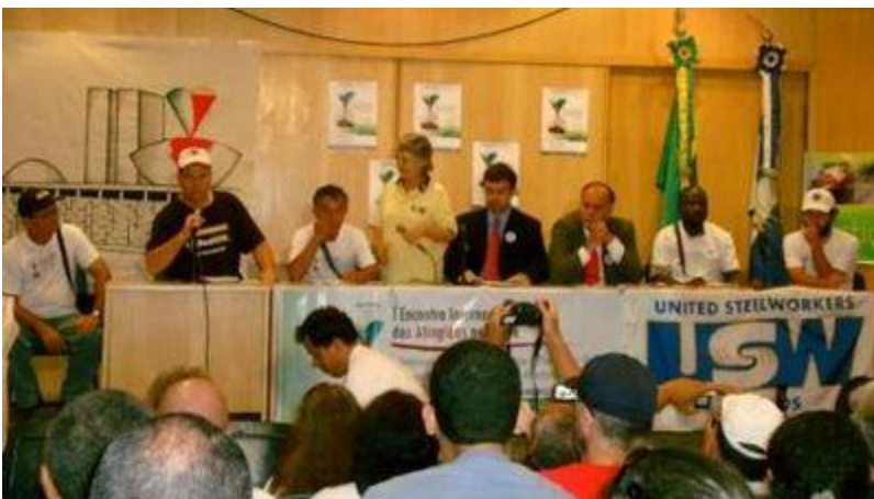
Presentación de casos de violaciones de derechos humanos ante diputados de Brasil 15.04.2010