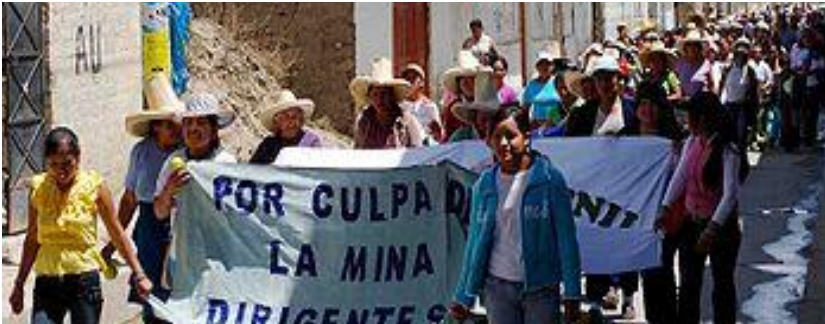
Marcha pacífica de familiares y pobladores del Valle de Condebamba en apoyo a los líderes durante la lectura de sentencia 21.08.2009.

Las Mesas de Diálogo parecen ser la única estrategia consistente desplegada desde Ministerio de Energía y Minas. Su eficacia es muy limitada como en el caso de la Mesa instalada en la provincia de Hualgayoc, la cual ha sido repetidas veces postergada y aún no ha generado ningún acuerdo estable. Continúan, sin embargo, las denuncias de pobladores sobre rajaduras de viviendas ocasionadas por las explosiones que realiza la empresa minera Gold Fields – La Cima en Hualgayoc.