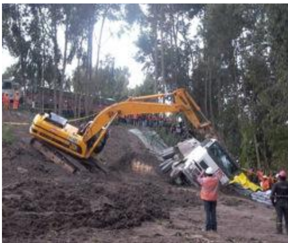
Accidente camión que transportaba concentrado de minera Gold Fields.

Los vacíos en las políticas ambientales del sector público y un marco normativo inapropiado son causas subyacentes de las tensiones y conflictos provocados por la actividad minera en Cajamarca. Minera Yanacocha fue el primer proyecto desarrollado como consecuencia directa de las políticas y normas implementadas como parte del proceso de reforma del estado iniciada en los años noventa. Un impacto de esta reforma paradójicamente ha sido el debilitamiento del propio sector público en sus capacidades tanto para gestionar las previsible transformaciones ambientales y sociales como para asegurar el respeto de los derechos de las poblaciones afectadas. Derechos fundamentales que no sólo son la base del bienestar, sino requisito de cualquier estrategia de desarrollo.